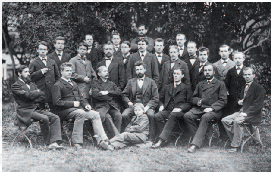
Firmengründer Ernst Leitz I. (Bildmitte) mit seinen Mitarbeitern im Schützengarten in Wetzlar. Zu seinen Füßen Sohn Ernst Leitz II., 1882

In der letzten Ausgabe der „informationen aus dem hwa“ haben wir über die Übernahme von Teilen des Unternehmensarchivs der Buderus AG in Wetzlar berichtet. Nicht weniger interessant ist aus historischer Sicht ein anderes Unternehmensarchiv aus Wetzlar, das die Leica Microsystems GmbH zwei Jahre zuvor als Depositum an uns abgegeben hat. Allerdings bildet es nicht die gesamte Tätigkeit der früheren Ernst Leitz GmbH ab. Mit der Trennung des Unternehmens in vier selbstständige Bereiche um 1990 wurde auch das Leitz-Archiv aufgeteilt. Alle Unterlagen, die mit dem Bau der weltberühmten Leica zusammenhängen, wurden der 1996/97 gegründeten Leica Camera AG überlassen. Der weitaus größte Teil jedoch – neben der Mikroskopsparte das Leitz-Familienarchiv und wichtige übergreifende Abteilungen wie Personal und Bauwesen – verblieben bei der Leica Microsystems GmbH.