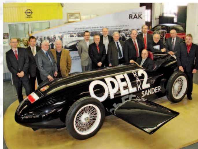
Teilnehmer in der Opel-Oldtimer-Werkstatt um einen Nachbau des Raketenswagens von 1928

Markante Karosseriepunkte wie Kanten, Bohrungen oder Durchgänge werden so registriert und mittels einer elektronischen Bildverarbeitung ausgewertet. Dritte Station war die Fertig- und Endmontage, deren Grundriss einem halben Stern