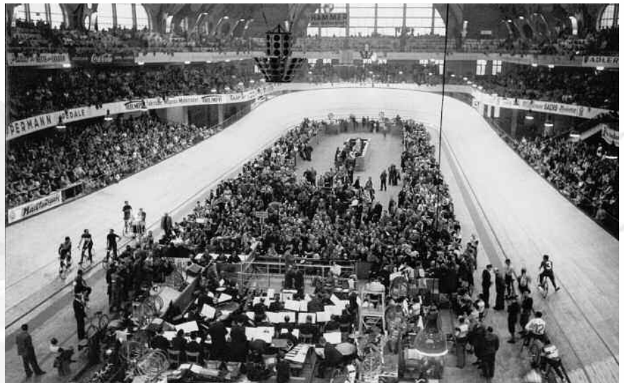
Sechs-Tage-Rennen 1954 in der Frankfurter Festhalle