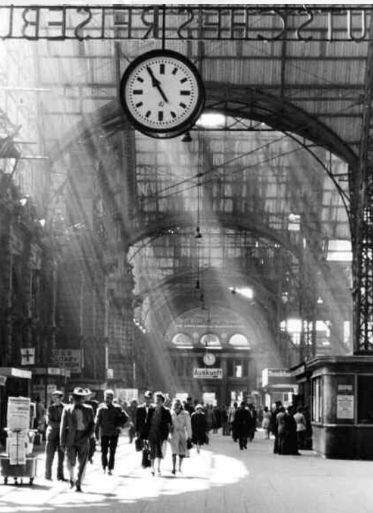
Der Frankfurter Hauptbahnhof 1951